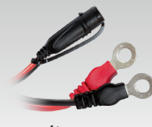
Pólus saru 45 cm - M6 029194