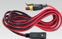
Hosszabbító 2.5 m - 029057