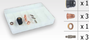
Kopóanyag doboz 039964