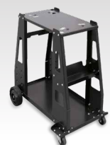
PLASMA 600 kocsi 040298