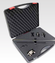
Compass kit 040205