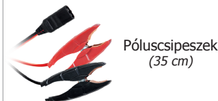
Póluscspeszek (35 cm)